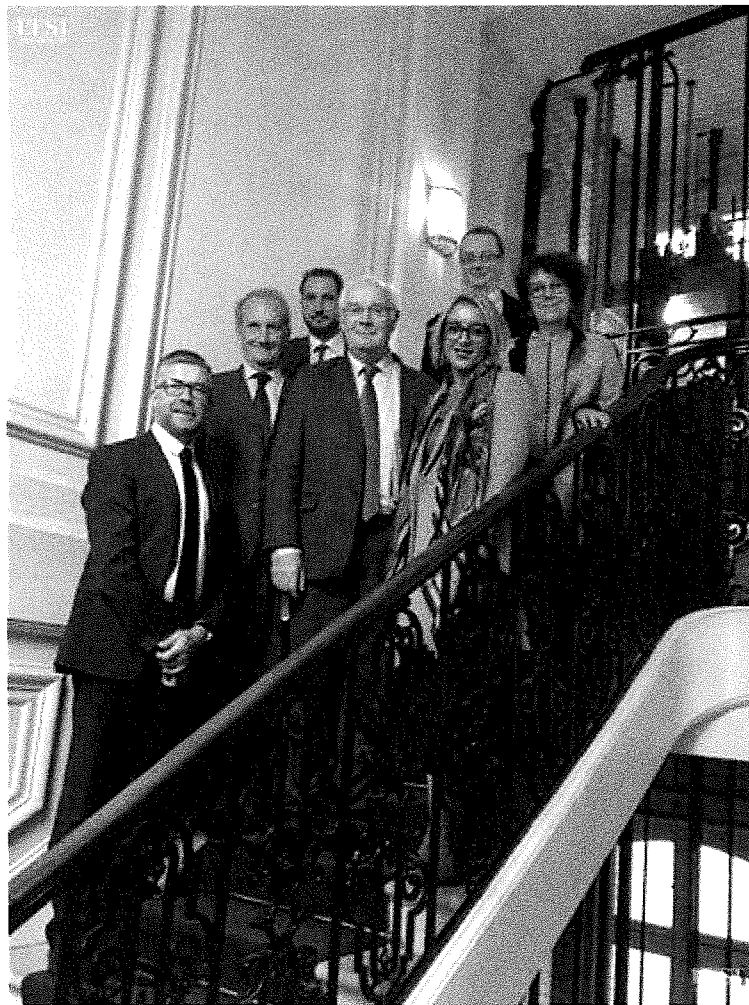
Les élus meusiens unis ce jeudi matin au ministère des Transports pour plaider avec succès le dossier de la RN135.